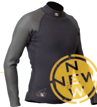
27270 Néoprène 1,5 mm