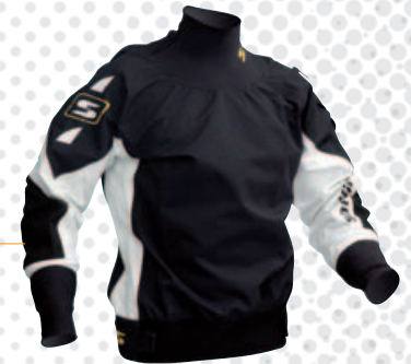
27200 Étanche, respirant