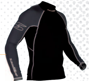
27250 Néoprène 0,5 mm