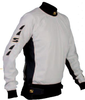
27100 Léger, respirant