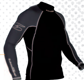
27250 Néoprène 0,5 mm