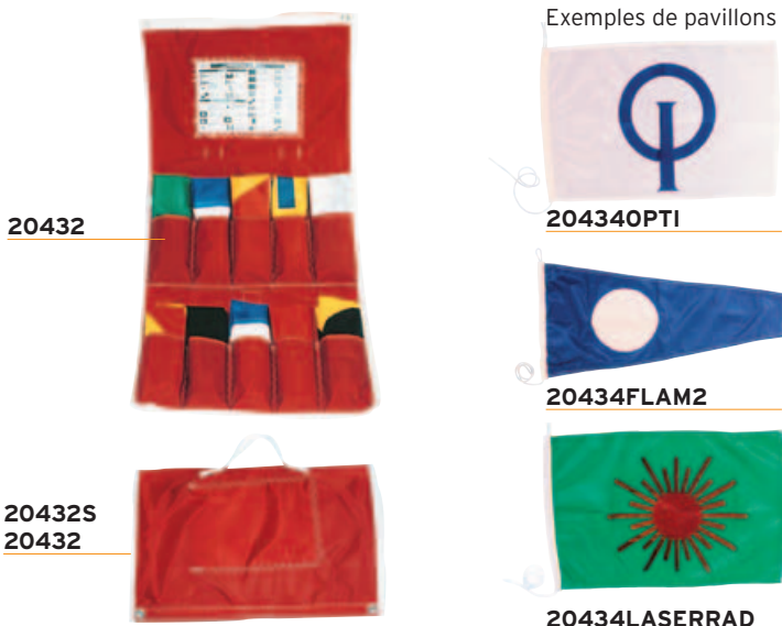
Exemples de pavillons